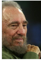
FIDEL CASTRO RUZ

"Educar es hacer prevalecer en la especie humana la conciencia por encima de los instintos".